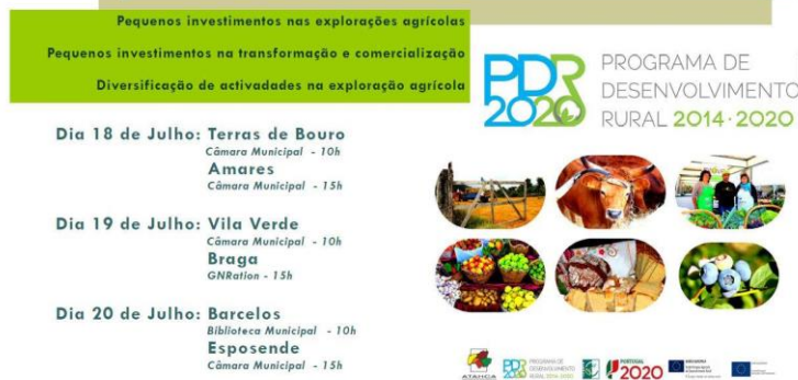
Cartaz de promoção das sessões de divulgação