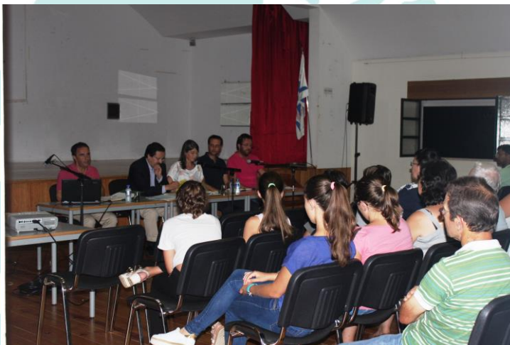
Aspecto de uma das sessões de divulgação realizadas no território

No âmbito do seu plano de animação e dinamização da EDL a ATAHCA promoveu também as seguintes sessões de divulgação da estratégia de desenvolvimento local, todas as terças e quintas-feiras na sede da ATAHCA, em horário pré-estabelecido ou noutros dias com pré-agendamento, durante o período de funcionamento normal.