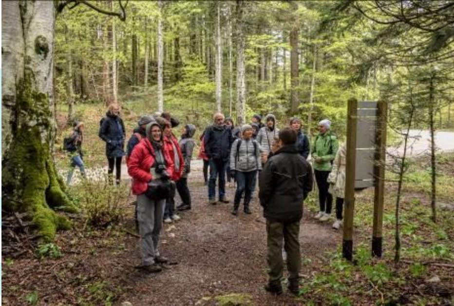
Visita de estudo aos territórios dos GAL parceiros da Estónia (12 a 17 de agosto de 2019)