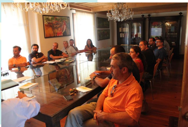
Aspecto de uma das sessões de divulgação realizadas na sede da ATAHCA